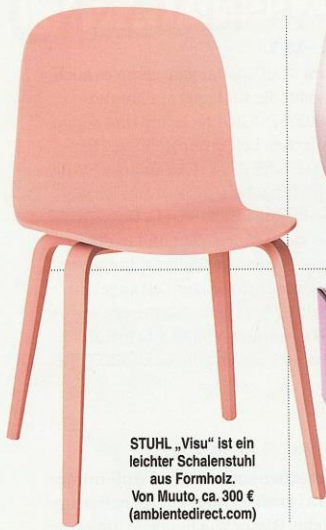
STUHL „Visu“ ist ein leichter Schalenstuhl aus Formholz. Von Muuto, ca. 300 € (ambiatedirect.com)