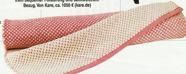
FAIR-TRADE-TEPPICH „Dots“ aus Baumwolle, 70 x 200 cm, ab ca. 70 € (milanari.com)