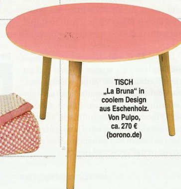
TISCH „La Bruna“ in coolem Design aus Eschenholz. Von Pulpo, ca. 270 € (borono.de)