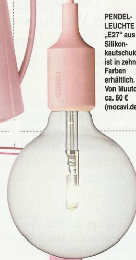
PENDELLEUCHT „E27“ aus Silikonkautschuk ist in zehn Farben erhältlich. Von Muuto, ca. 60 € (mocavi.de)