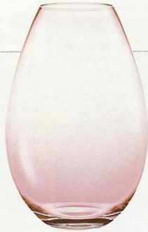
VASE „Cocoon“ ist in unterschiedlichen Größen erhältlich. Von Holmegaard, ab ca. 50 € (desiary.de)