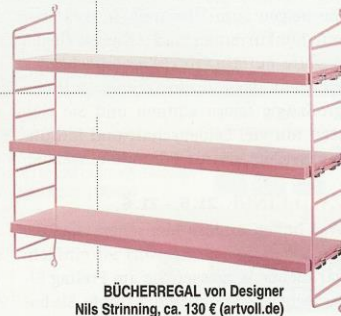
BÜCHERREGAL von Designer Nils Strinning, ca. 130 € (artvoll.de)