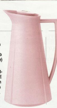
ISOLIERKANNE in modernem Design. Von Rosendahl, ca. 50 € (conceptroom.de)