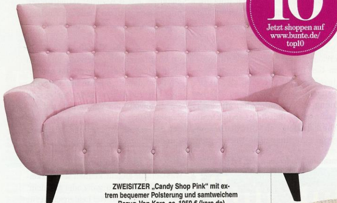
ZWEISITZER „Candy Shop Pink“ mit extrem bequemer Polsterung und samtweichem Bezug. Von Kare, ca. 1050 € (kare.de)

TOP 10 Jetzt shoppen auf www.bunte.de/top10