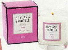
DUFTKERZE „Home Rose“ , hergestellt aus 100% reinem Soja. Von Heyland & Whittle, ca. 30 € (heylandandwhittle.de)