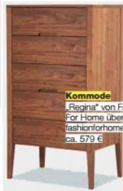
Kommode „Regina“ von Fashion For Home über fashionforhome.de , ca. 579 €