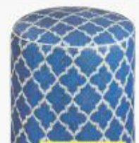
Outdoor-Pouf „Tangier“ von Milanari über milanari.com , ca. 139 €