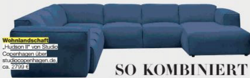
Wohnlandschaft „Hudson II“ von Studio Copenhagen über studiocopenhagen.de , ca. 2799 €

TEXTE: ANJIE FASHWAUER; FOTOS: FELIX FORBSTÄUWING/INSIDE (2), GETTY IMAGES (2), OCEANIC AGENCY, PR