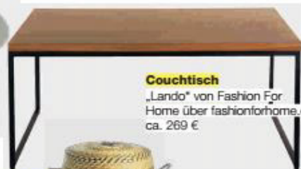
Couchtisch „Lando“ von Fashion For Home über fashionforhome.de , ca. 269 €