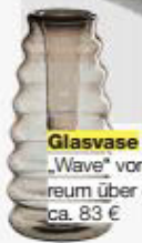
Glasvase „Wave“ von Verreum über desiary.de , ca. 83 €