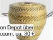
Strohkorb mit Deckel von Depot über depot-online.com , ca. 30 €