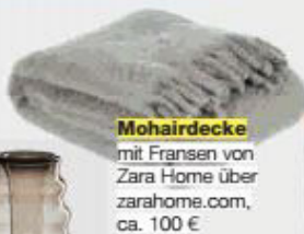
Mohairdecke mit Fransen von Zara Home über zarahome.com , ca. 100 €