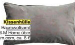
Kissenhülle aus Baumwollsamt von H & M Home über hm.com , ca. 8 €